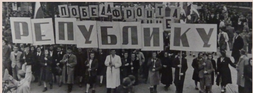
Predizborni miting u Beogradu 1945.