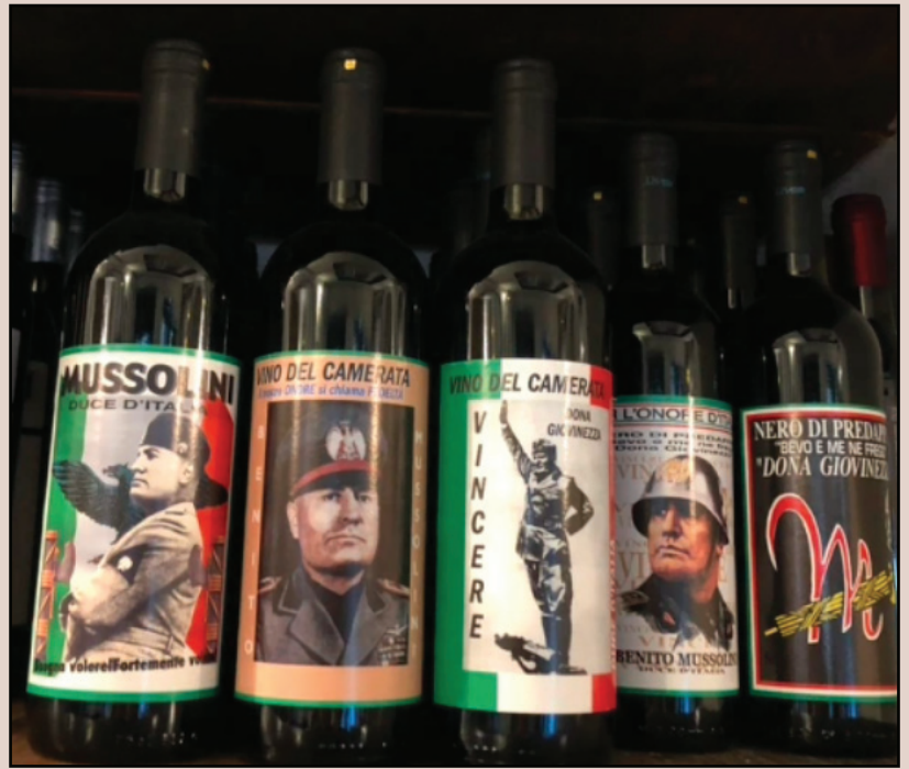
Fašistički simboli i Mussolinijeve slike u milanskom restoranu Restoran 'Kod Oscara', u kojem se veličaju fašizam i njegov vrhovni vođa u Italiji, postoji već 40 godina u Milanu.