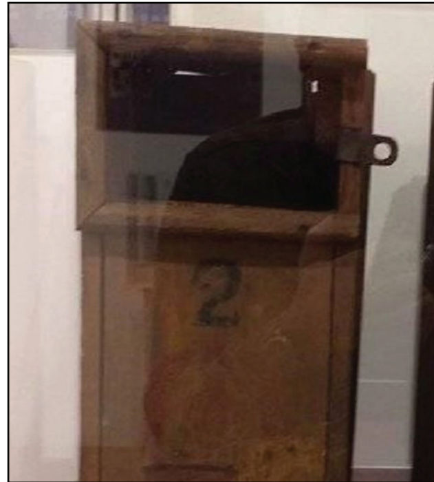
Čorava kutija u Valjevskom muzeju