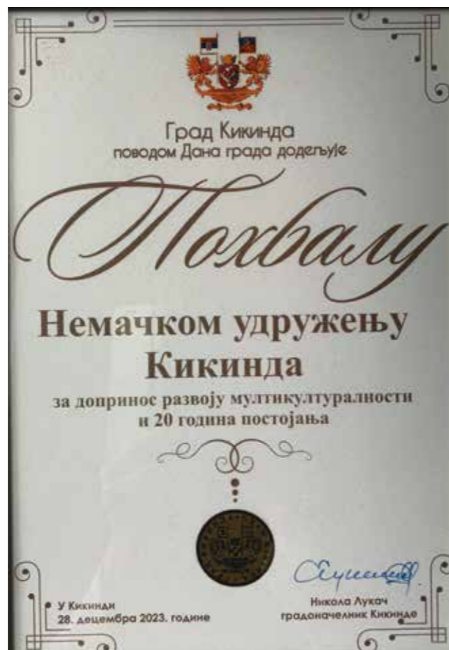
Pohvala grada Nemačkom udruženju Kikinda

Pored dela Wagnera, na programu sopranistkinje bila su dela Verdija, Rachmaninoffa, Milojevića, R. Straussa i drugih kompozitora. Publika je sa uživala i oduševljenim aplauzom nagradila izvedbu svakog muzičkog dela.