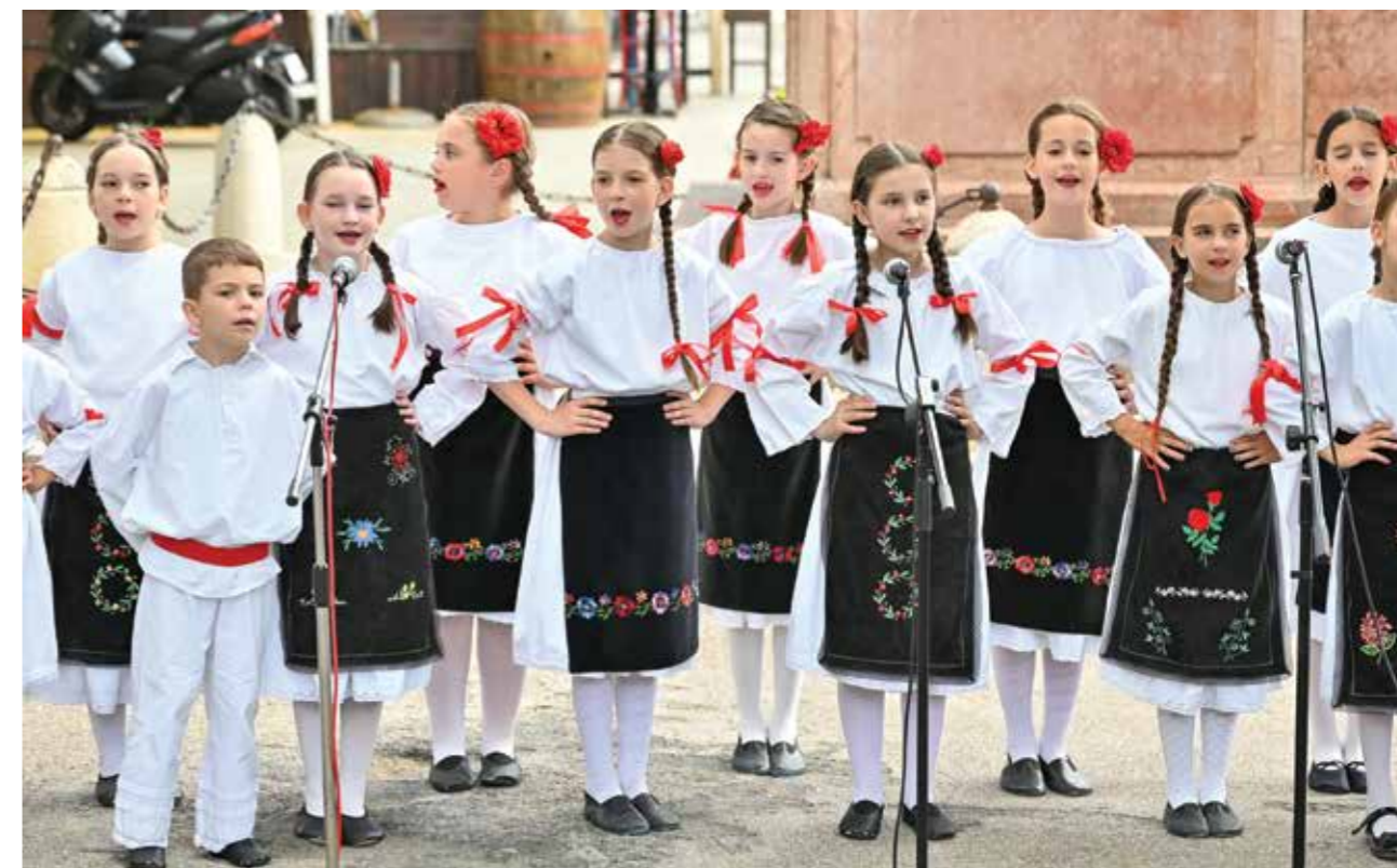
OKUD „Brankovo kolo“