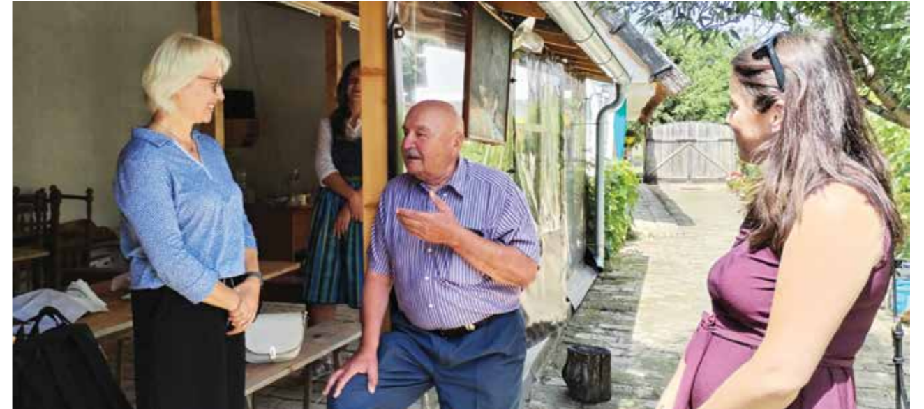
Gäste aus Deutschland besuchen Sr. Karlovci, Gosti iz i Nemačke u poseti Sr. Karlovcima

Ovu posetu ocenjujemo kao veoma važnu i značajnu ne samo za preostale Podunavske Švabe koji i danas žive u Vojvodini, nego i za Sremske Karlovce i Fondaciju ZAVIČAJNA KUĆA. Zato i FENSTER (Fondacija je izdavač) daje značaj ovoj poseti sa posebnim osvrtom na posetu Fondaciji ZAVIČAJNA KUĆA.