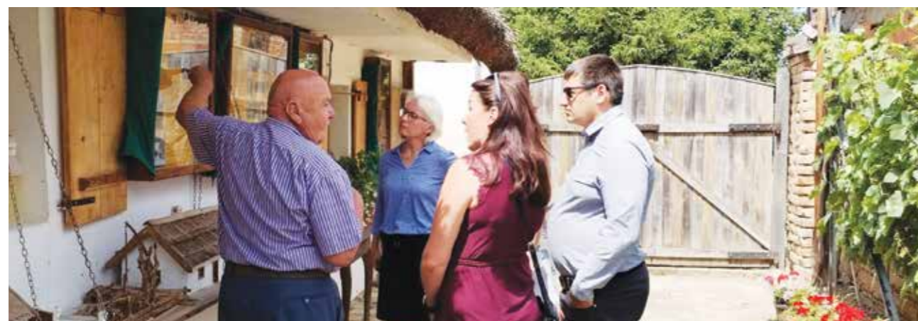
Gäste aus Deutschland besuchen Sr. Karlovci, Gosti iz i Nemačke u poseti Sr. Karlovcima

U Fonadaciji su ih dočekali Predsednik Fondacije i Predsednik Upravnog odbora Fondacije, kao i nekoliko aktivista. Domaćini su boravak gostiju u Fondaciji iskoristili da ih poznaju sa aktivnostima Fondacije, etno postavkom, kao i stalnom izložbom PODUNAVSKE ŠVABE REČJU, SLIKOM I FOTOGRAFIJOM, te aktivnostima časopisa FENSTER. Gosti su sa pažnjom slušali izlaganja domaćina i sa interesovanjem razgledali etno postavku i stalnu izložbu.