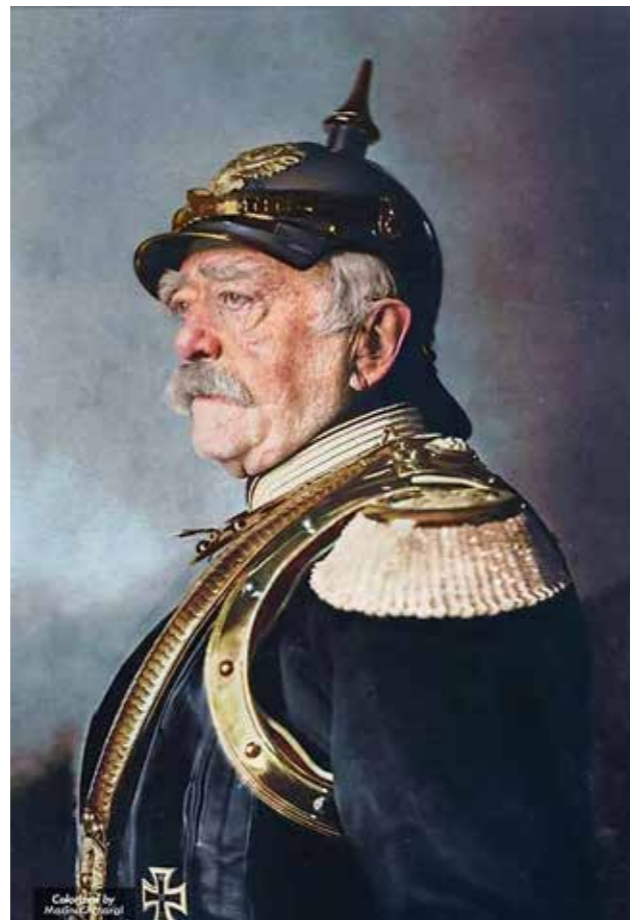
Oto fon Bizmark

Entstehen des einheitlichen deutschen Staates in Vergessenheit zu drängen. Am 18. Januar 1871, also knapp vor 150 Jahren, ist der größte Wunsch aller Deutschen seit dem Freiheitskrieg gegen Frankreich Anfang des 19. Jahrhunderts in Erfüllung gegangen. Das Reich hätte nie entstehen können, wenn das ganze Volk dies nicht gewollt hätte. Deutschland war bis zur Vereinigung ein Gebilde von vielen kleinen und großen Fürstentümern und freien Städten. Diese Kleinstaaterei hat natürlich der kleine Mann büßen müssen. Andererseits war es klar, dass die damaligen Großmächte, vor allem Frankreich, diesen Zustand um jeden Preis beibehalten wollten. Umso erstaunlicher ist es, dass namhafte deutsche Historiker kein gutes Wort über Otto von Bismarck und sein Werk, die Schaffung des vereinigten Deutschen Reiches verlieren. Da ist die Rede von der „aufgezwungenen Vereinigung“ das auch ihre Meinung? 4 Das Donautal-Magazin Nr. 230 vom 1. Dezember 2023 gung“, Preußen soll die Einheit auf dem Schlachtfeld erzwungen haben, das Reich wäre ein Staat