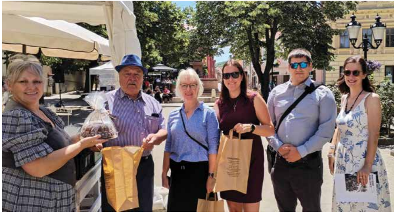
Gäste aus Deutschland besuchen Sr. Karlovci, Gosti iz i Nemačke u poseti Sr. Karlovcima