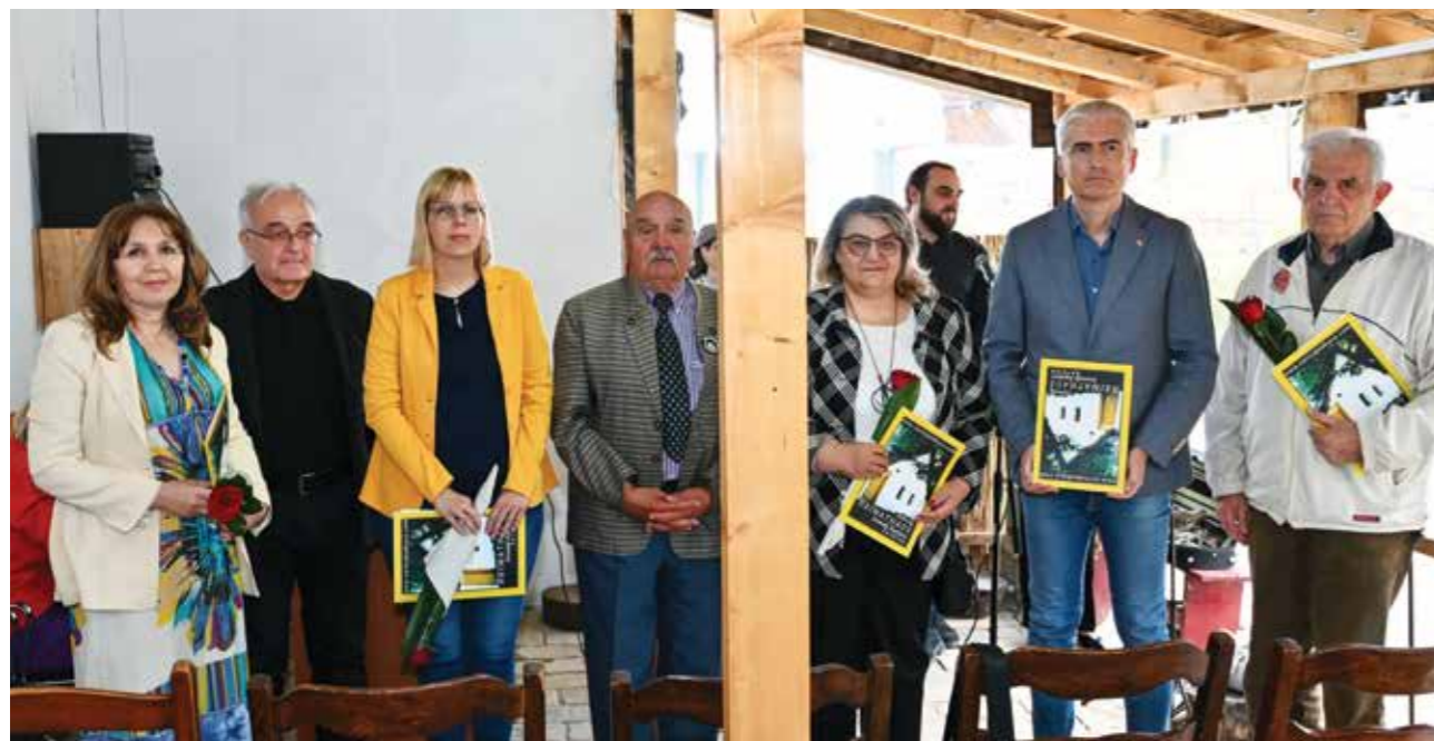
Zajednička foografija dobitnika priznanja

den. Auf welche Weise auch immer das Erbe bewahrt wird, ist es wichtig sowohl für die in diesem gebiet lebenden Deutschen, als auch für jene, die fortgezogen sind.“