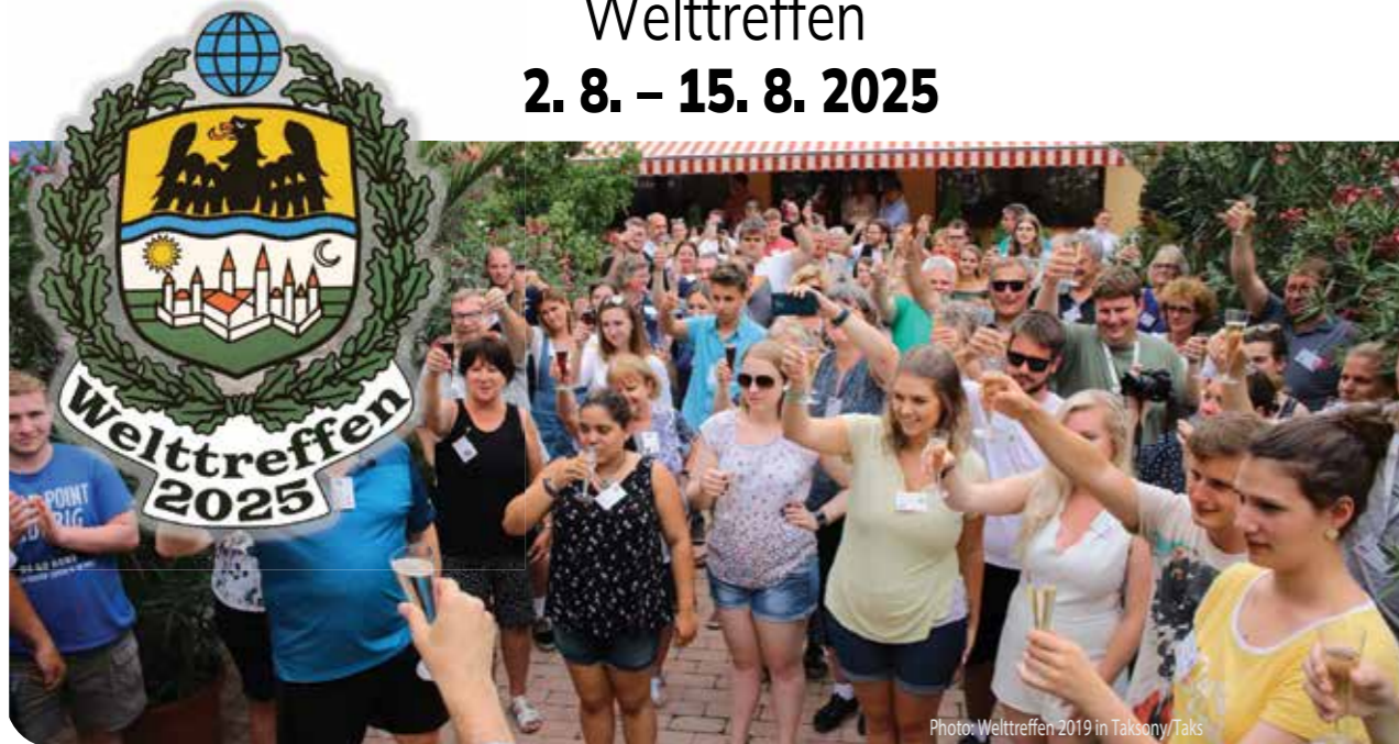
Photo: Welttreffen 2019 in Taksony/Taks