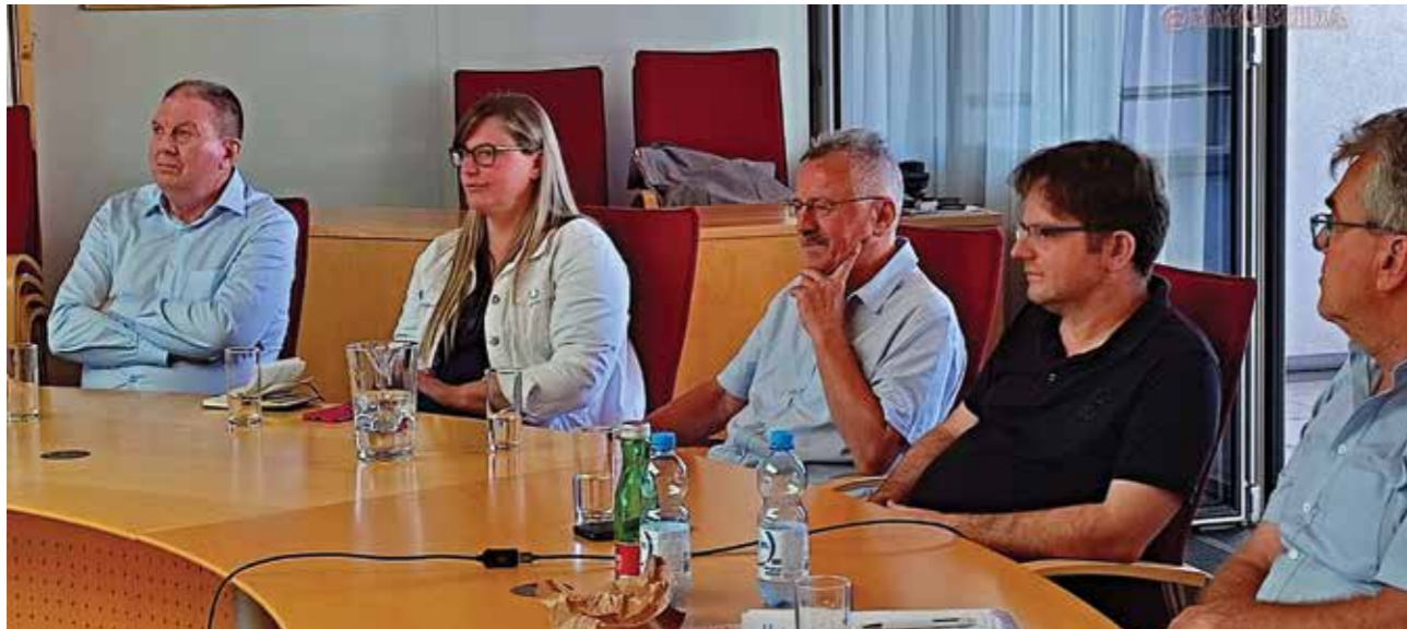
Generalna skupština Svetskog saveza Podunavskih Švaba