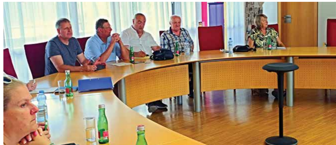
Generalna skupština Svetskog saveza Podunavskih Švaba

Unsere Reaktion auf dieses Schreiben kann nur positiv ausfallen, da wir diesen Besuch als willkommen und wünschenswert betrachten. Daher möchten wir betonen, dass wir auch zukünftig solche Besuche als Beitrag zur Bewahrung der Kultur und Tradition der Donauschwaben erwarten. Ob unser Mutterland derselben Meinung ist, werden wir bald erfahren.