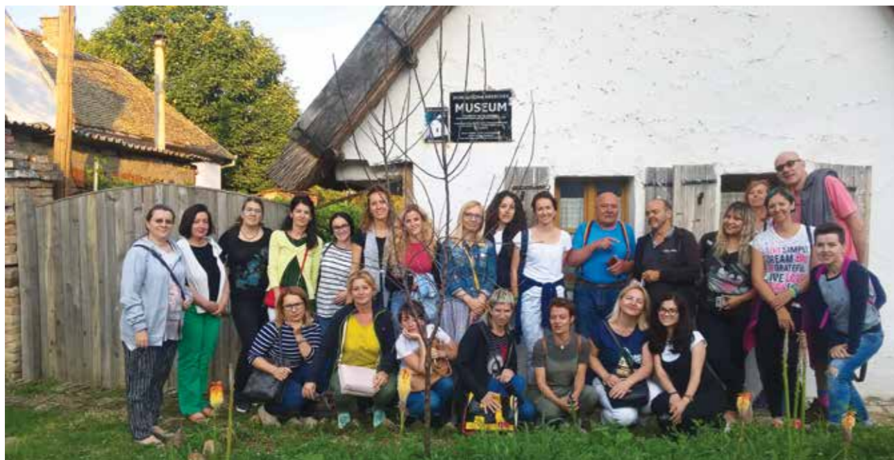
Poseta Zavičajnoj kući

ja podrška države, a naše matice (Nemačka i Austrija) ne pokazuju dovoljno (skoro nikakvo) interesovanje za svoju manjinu u Srbiji.