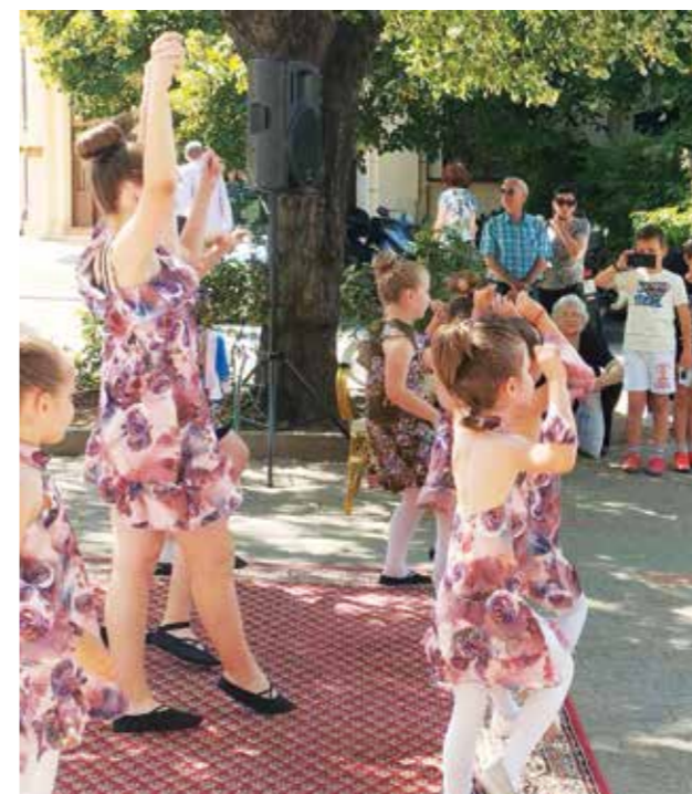
Plesna grupa Altair

So lautete die in den Medien verbreitete Nachricht über die Gedenkfeier am Ort des Leidens vieler junger Menschen. Unter den Pfernd befand sich auch die Tochter unseres