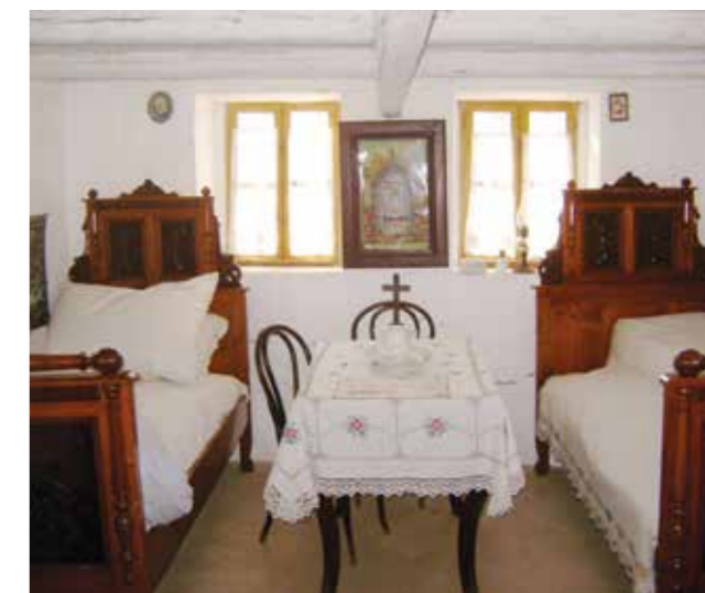
Zavičajna kuća - soba

Die römisch-katholische Kirche der Heiligen Dreifaltigkeit in Sremski Karlovci war Gastgeberin aller Konzerte, die Teil des Gugelhupffestes oder anderer Veranstaltungen waren. Der akustische Raum hat maßgeblich zur Steigerung des künstlerischen Eindrucks dieser Konzerte beigetragen, wodurch das gesamte Programm an Qualität gewonnen hat. Im Laufe der Jahre hat auch der Chor der Kirche der Heiligen Dreifaltigkeit an diesen Konzerten teilgenommen. Als gute Gastgeberin stellte die Kirche nach Konzerten ihre Räumlichkeiten für Cocktailempfänge und geselliges Treffen von Teilnehmern und Zuschauern zur Verfügung.