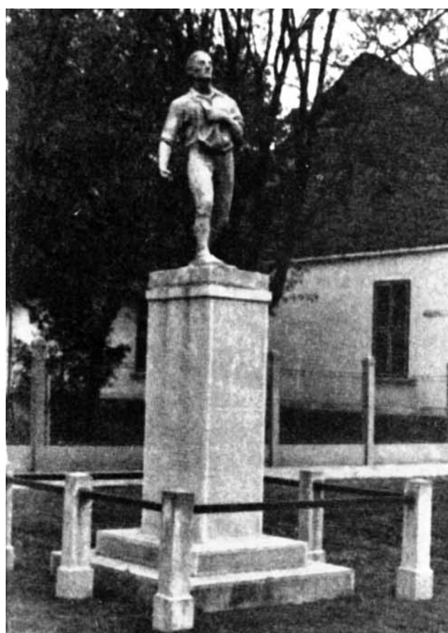
Spomenik u Bačkom Petrovcu "Sejač" autora Sebastijana Lajhta podignut 1936. godine povodom 150-godišnjice doseljavanja podunavskih nemaca, Koji je Sebastijan Lajht besplatno uradio svom rodnom mestu, a uklonjen je oko 1952. godine i zakopan ispred katoličke crkve